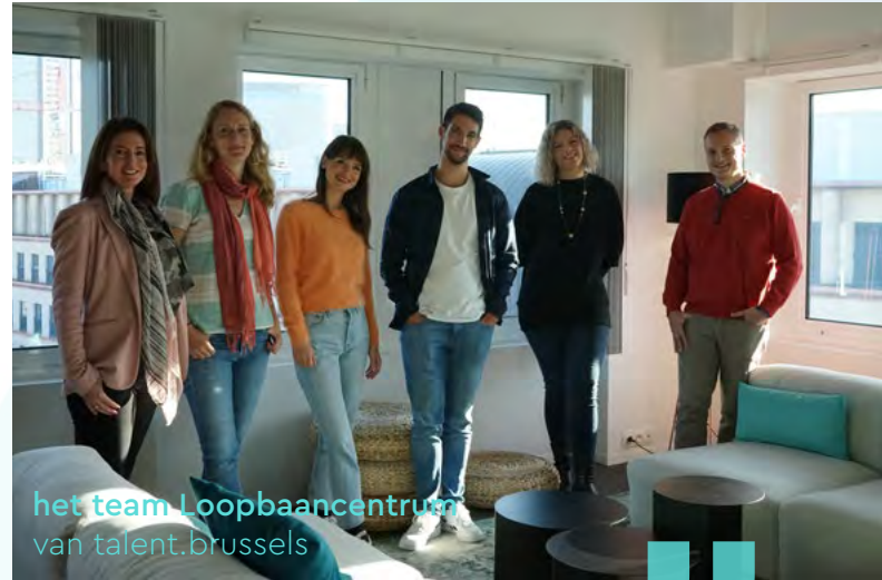
het team Loopbaancentrum van talent.brussels

« MyTalent Learning is dé manier om uw talent bij te spijkeren waar en wanneer u maar wilt dankzij e-learningcursussen! »