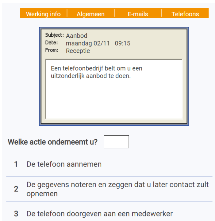
Figuur 3. Voorbeeld van een oefenitem

Om deze competentie te meten gebruiken we een test die uw besluitvaardigheid in kaart brengt. De test gaat uw vermogen na om beslissingen te nemen op basis van de gegeven informatie en/of op basis van “gezond verstand”.