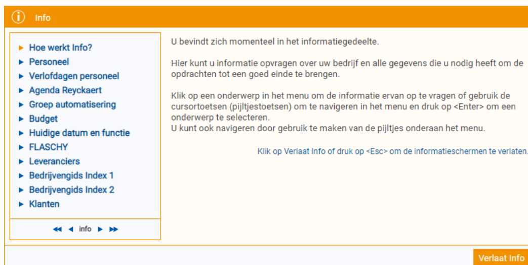
Figuur 2. Voorbeeld van het gegevensbestand

U wordt in de rol van een secretariaatsmedewerker geplaatst . U moet vragen beantwoorden over collega's, leveranciers en producten van die leveranciers. Hiervoor beschikt u over een uitgebreid dossier met informatieschermen. Om de vragen snel te kunnen beantwoorden, moet u via overzichtsschermen detailinformatie opvragen. Voor een aantal vragen volstaat het om één pagina te consulteren, voor andere vragen moet u verscheidene gegevens met elkaar in verband brengen.