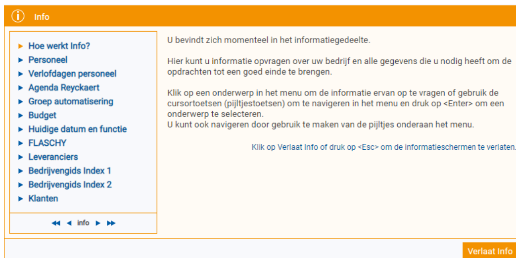
Figuur 2. Voorbeeld van het gegevensbestand

U wordt in de rol van een secretariaatsmedewerker geplaatst . U moet vragen beantwoorden over collega's, leveranciers en producten van die leveranciers. Hiervoor beschikt u over een uitgebreid dossier met informatieschermen. Om de vragen snel te kunnen beantwoorden, moet u via overzichtsschermen detailinformatie opvragen. Voor een aantal vragen volstaat het om één pagina te consulteren, voor andere vragen moet u verscheidene gegevens met elkaar in verband brengen.